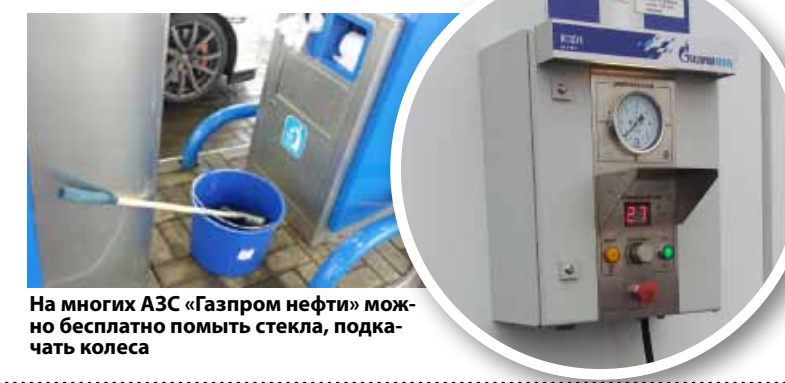
На многих АЗС «Газпром нефти» можно бесплатно помыть стекла, подкачать колеса